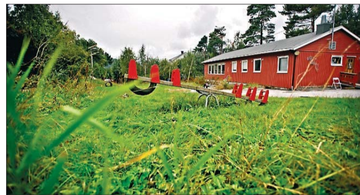
MYRLAND. Dette området, der Myrland barnehage tidligere holdt til, vil foreldre ha som leikeplass på Myrland.

VAP-virksomheten legger ofte ved en påminnelse om å tenke trafiksikkerhet når de må be huseiere om å beskjære hekker og trær. Der er det også klart understreket at hekk, busker og trær ikke må skjule vegmerking, trafikkskilt eller gatenavnskilt.