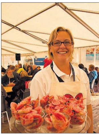
GODBITER. Reker gjør alltid susen etter en lang og hard ekspedisjon.