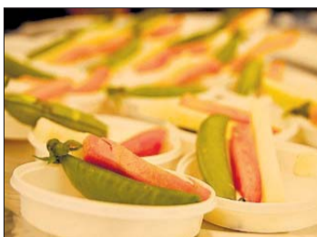
GRØNNSAKER. Etter å ha stappet i seg kjøtt, fisk, ost og andre delikatesser, er det godt å få i seg litt vitaminer på slutten av dagen.