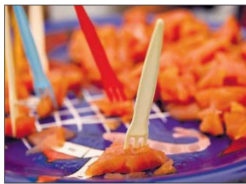
GAFI I VEI. Om du er ute etter gratis laks, er matfestivalen absolutt noe for deg. Det er ikke langt mellom bodene med forskjellig sjømat.