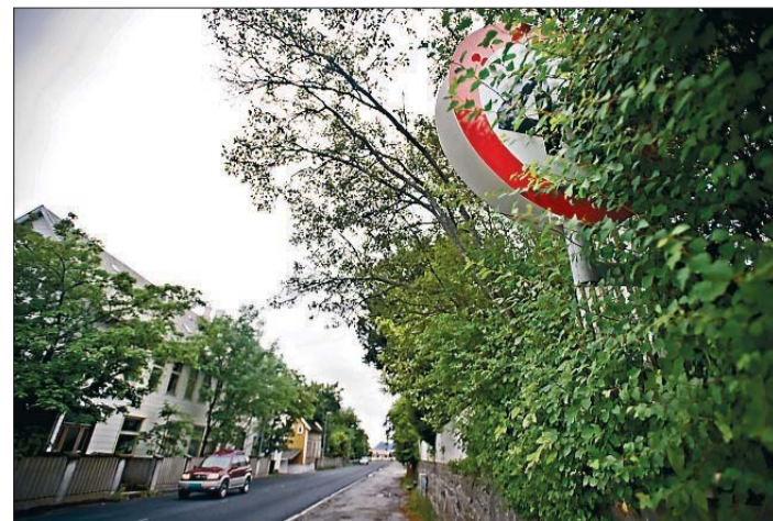
SKILT. Det er ikke lett å få øye på dette skiltet som står på nordsida av Borgundvegen, like vest for Bønørve.

MARTINE S. GUNNARSDOTTIR martine.sovik.gunnarsdottir@smp.no