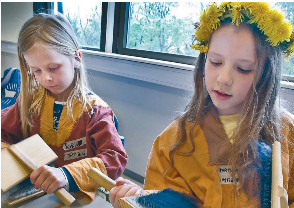
SKULEARBEID. Barneskulen på Giske brukar Giskespelet som ein del av historieundervisninga. Mellom anna har elevane ei heil vikingveke på våren, i tillegg til sjølve deltakinga i spelet.